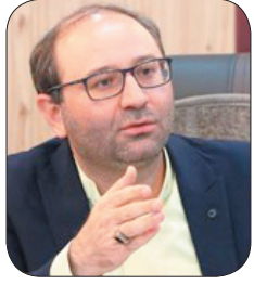
شهریار شهریوند خیابان ملت شهر کرد پیساده راه گردشگری می‌شود