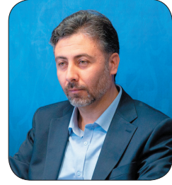
مدیرکل صنعت، معدن و تجارت چهارمحال و بختیاری: وجود ۳۰ محصول صادرات محور در چهارمحال و بختیاری