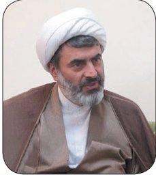
مدیرکل تبلیغات اسلامی چهارمحال و بختیاری: تبدیل نشر به خیر یکی از رسالت های اصلی خبرنگاران است