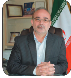
رئیس پارک علم و فناوری چهارمحال و بختیاری: رویادهای کسب و کار جدید در حوزه های هوش مصنوعی پرکار می شود