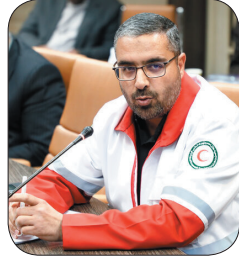
مدیرعامل جمعیت ملل احمد چهارمحل و بختیاری: ارائه خدمات امدادی به ۴۱۵ حادثه دیده در چهارمحل و بختیاری