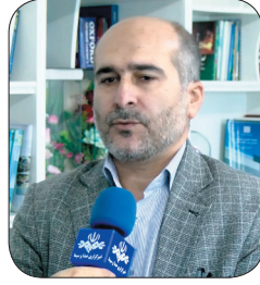
مدیرکل بیمه سلامت چهارمحال و بختیاری: یک‌هزار و ۵۸۸ بیمار ناباور نشان‌دار در چهارمحال و بختیاری