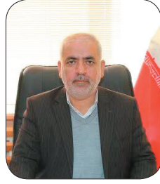
مدیرکل راه و شهرسازی چهارمحال و بختیاری، آغاز تحویل خانه های طرح نهدت ملی مسکن در شهر کرده از ماه جاری