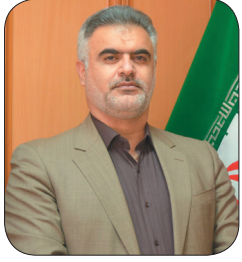
مدیر شرکت ملی بخش فرآورده های نفتی منطقه چهارمحال و بختیاری، ۳۷۱۰ خودرو در منطقه چهارمحال و بختیاری دو گانه سوز شد