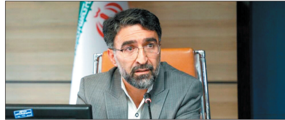
نیاز تکمیل و ساخت این اردوگاه در دستور کار قرار گرفت.

سفرهای استانی رئیس جمهور به چهارمحال و بختیاری اعتبار مورد نیاز تکمیل و ساخت این اردوگاه در دستور کار قرار گرفت.