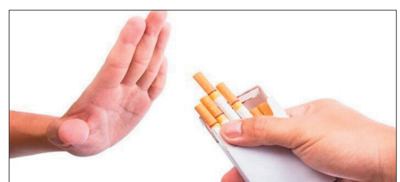
معاون فنی مرکز بهداشت چهارمحال و بختیاری گفت: شهر فرخ شهر، روستای هرچگان و پارک جانبازان شهر کرد به عنوان مراکز بدون دخانیات