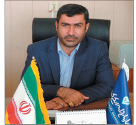
مدیرکل دامپزشکی چهارمحال و بختیاری گفت: پست قرنطینه در سه راهی کوشگی، با هدف کنترل بیماری ها، قاچاق دام از استان و... تا پایان سال احداث خواهد شد.