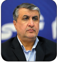
رئیس سازمان انرژی اتمی در سفر به چهارمحال و بختیاری: فعالیت هسته ای ایران در قانون اقدام راهبردی در چهارچوب پادمان است