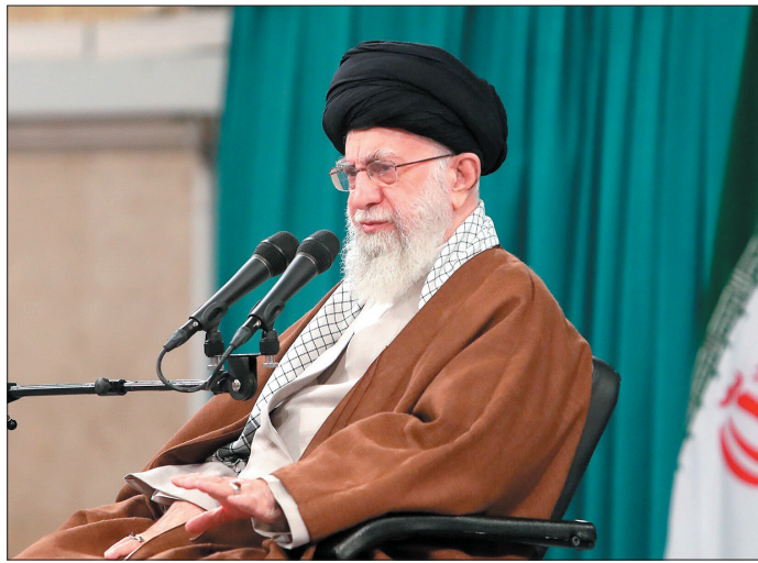
روح‌الله خامنه‌ای در جریان سخنرانی در مشهد.

نکته پایانی آنکه نقش کشورهای منطقه در نشست تهران و دی ۸ را می‌توان بعد دیگری از بلوغ سیاسی و درک مشترک کشورهای منطقه در رفع کاستی‌ها و مشکلات منطقه با محوریت افغانستان و فلسطین ارزیابی نمود که می‌تواند در چپش ساختار نظم نوین چند جانبه گرایانه جهانی تاثیر گذار باشد. در پرونده‌ای که غرب از آنها علیه امنیت و ثبات منطقه بهره برداری می‌کند. انتقال داعش به افغانستان و تقاریر نامانی در منطقه، تحریم‌های اقتصادی و بلوکه کردن دارایی‌های افغانستان، دامن زدن به اختلافات مرزی میان همسایگان و جلوگیری از حل این مسائل از راهکار سیاسی و گفت‌وگو، محور، حمایت از گروه‌های تروریستی نظیر جیش الظلم در ایران و تجزیه طایان در پاکستان و... از جمله این رفتارها علیه امنیت و ثبات منطقه است. در حوزة فلسطین نیز آمریکایی‌ها با حمایت‌های تمام قد از رژیم صهیونیستی در کنار نسل‌کشی در غزه به دنبال تحمیل نظم مورد نظر خود به منطقه یعنی تسلیم‌سازی کشورها در برابر زیاده‌خواهی‌های خود و رژیم صهیونیستی می‌باشند. به عبارتی دیگر آمریکا، افغانستان و فلسطین را به مولفه‌های بحران‌سازی در منطقه مبدل ساخته است حال آنکه پادزهر این زهر را همکاری منطقه‌ای می‌باشد. مولفه‌ای که ایران همواره آمادگی خود را برای تحقق آن اعلام داشته است که ابتکار عمل برگزاری نشست گروه تماس در تهران برای افغانستان و نیز مشارکت فعال در نشست دی ۸ با طرح‌های راهبردی و عملیاتی در قبال مسئله فلسطین، گواهی بر این حقیقت و نقش آفرینی می‌باشد.