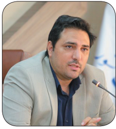
رییس جبهه کشاورزی چهارمحال و بختیاری؛ تولید بیش از ۲ میلیون تن محصول کشاورزی در چهارمحال و بختیاری