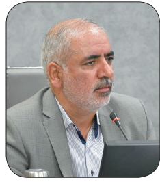
مدیرکل راه و شهرسازی چهارمحال و بختیاری: تیت نام بیش از ۱۰۲ هزار نفر در نهضت ملی مسکن چهارمحال و بختیاری