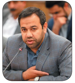
مدیرعامل شرکت شهرکهای صنعتی چهارمحال و بختیاری: پرداخت تسهیلات بانکی سه واحد های صنعتی مستقر در شهرکها