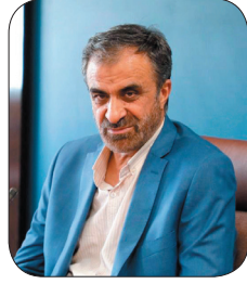
استاندار چهارمحال و بختیاری: رفع مشکلات مردم به مشارکت حداکثری در انتخابات کمک می‌کند