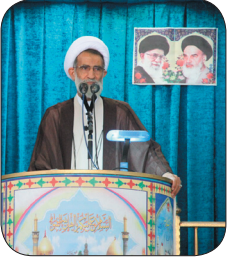
امام جمعه شهرکرد: خدمات ریسی جمهور شهید در کشور ماندگار است