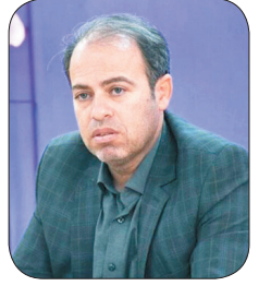
فرماندار شهرکرد: تعیین ۱۳۵ شعبه اخذ رای در شهرستان شهرکرد برای انتخابات ریاست جمهوری