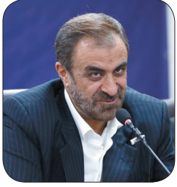
استاندار چهارمحال و بختیاری: اهتمام جدی برای جذب اعتبارات صورت گیرد