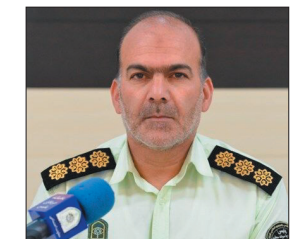
مضریه نافیان، خبرنگار زردکوه: سرهنگ "سلیمان ریاحی" در تشریح جزئیات این خبر گفت: در راستای ارتقاء امنیت اجتماعی، طرح آرامش در شهر، توسط عوامل انتظامی و پلیس

مبارزه با مواد مخدر استان به مرحله اجرا درآمد. وی در ادامه با بیان اینکه در این طرح با هماهنگی مرجع قضائی پلیس مبارزه با مواد مخدر استان با همکاری سایر یگان های انتظامی استان انجام شد که در طی ۲ روز موفق شدند ۱۷۷ نفر از مجرمان مواد مخدر در سطح حوزه های استحضاتی را دستگیر و جمع آوری و تحویل مقامات قضائی دهند. سرهنگ "ریاحی" افزود: در این راستا ۴۲ کیلوگرم انواع مواد