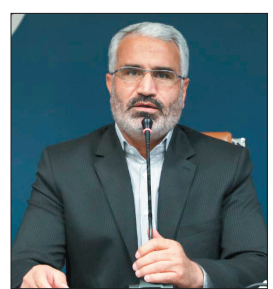
رئیس ستاد انتخابات چهارمحال و بختیاری گفت: تمهیدات لازم برای برگزاری چهاردهمین دوره انتخابات ریاست جمهوری در استان فراهم شده است و در همین

وی با اشاره به تشکیل ۲۹ هیات اجرایی در استان، تصریح کرد: ۱۲ هیات اجرایی در مراکز شهرستان‌ها و ۱۸ هیات