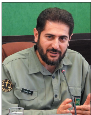
کامل به دامان طبیعت باز خواهد گشت.

روستاهای باله و کاوند درویشان خرس نجات یافت و تحت مداوا قرار گرفت. مدیرکل حفاظت محیط زیست چهارمحال و بختیاری با بیان اینکه هم‌اکنون خرس در مرحله ریکاوری قرار دارد، افزود: این خرس پس از سلامتی کامل به دامان طبیعت باز خواهد گشت.