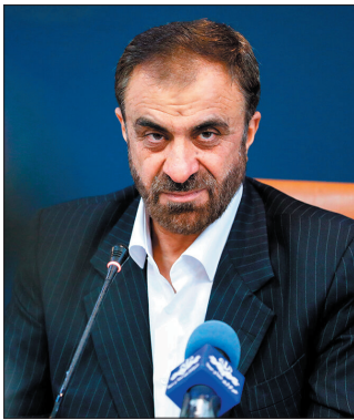
استاندار چهارمحال و بختیاری رفع تنش آبی در استان از جمله در شهرستان خانمیرزا را از برنامه‌های مهم دولت سیزدهم برشمرد و گفت: این مهم با

مشارکت فراگاه امام حسن(ع) در حال انجام است. غلامعلی حیدری در نشست شورای اداری شهرستان خانمیرزا افزود: تامین آب شرب برای مردم تمامی نقاط استان در اولویت برنامه‌ها دارد و در همین راستا رفع تنش آبی شهرستان خانمیرزا نیز موضوع مهمی است و همان‌طور که در ابتدای دولت وعده داده شد در حال انجام است. وی ادامه داد: در حال حاضر آبرسانی پایدار به ۴۳ روستا در قالب جهاد آبرسانی با مشارکت فراگاه امام حسن مجتبی(ع) در شهرستان خانمیرزا در حال انجام است. استاندار چهارمحال و بختیاری در ادامه یکی از اهداف سفرهای استانی را دیدار با