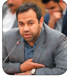
مدیرعامل شرکت شهرکهای صنعتی چهارمحال و بختیاری، ۳۶ طرح زیرساختی در شهرکهای صنعتی چهارمحال و بختیاری اجرایی شد