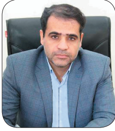
مدیرعامل شرکت توزیع برق چهارمحال و بختیاری، میزان مصرف برق در چهارمحال و بختیاری افزایش یافت