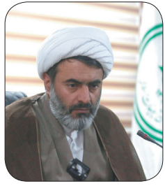
مدیرکل تبلیغات اسلامی چهارمحال و بختیاری: اهمیت تبیین آیات قرآن کریم توسط مؤسسات قرآنی