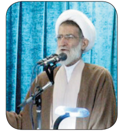
نماینده ولی فقیه در چهارمحال و بختیاری: شرکت در انتخابات از مظاهر تقوای سیاسی است