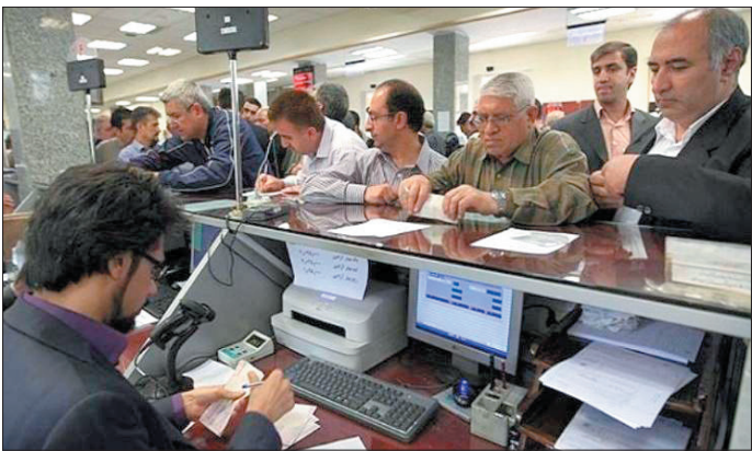
فکری به حال این خلاهای قانونی و دوردزد ارباب رجوع کنیم؟!

این ها بخشی از نعمات سرشار خداوندی است که دریای خزر نهفته اند و لزوم برنامه ریزی گسترده و منطقی را در راستای استفاده بهینه و مطلوب از آنها به ما یادآور می سازد. فراهم نمودن بستر ایجاد اشتغال با محوریت سکنه بومی، پاکسازی دریا و جلوگیری