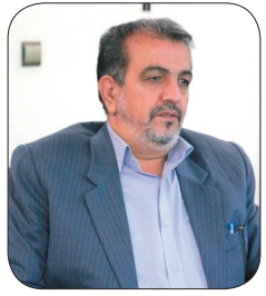
مدیرکل منابع طبیعی تأکید کرد: گرمای هوا و خطر آتش‌سوزی در صه‌های طبیعی در مناطق جنوبی چهارمحال و بختیاری