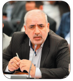
مدیرکل راه و شهرسازی چهارمحال و بختیاری: یک هزار و ۷۷۳ واحد مسکونی در چهارمحال و بختیاری افتتاح شد