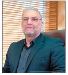
مدیرعامل شرکت کان چهارمحال و بختیاری خیرباد، گازسانی به ۲۱ روستای شهرستان لردگان در دستور کار است