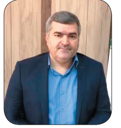
رئیس سازمان مدیریت و برنامه‌ریزی استان: چهارمعال و بختیاری از نظر نرخ بیکاری در رتبه ۱۵ قرار دارد