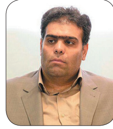
مدیرکل کمیته امداد استان چهارمحال و بختیاری: ۴۵ سرفه‌گیر به میان نوزادان نیازمند چهارمحال و بختیاری توزیع شد