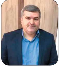
رئیس سازمان مدیریت و برنامه‌ریزی چهارمحال و بختیاری برنامه عملیاتی شعار سال با بهره‌گیری از روش‌های علمی در چهارمحال و بختیاری تدوین شد