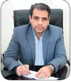
مدیرعامل شرکت توزیع نیروی برق چهارمحال و بختیاری: شکست رکورد مصرف برق در استان چهارمحال و بختیاری با ۵۲۰ مگاوات