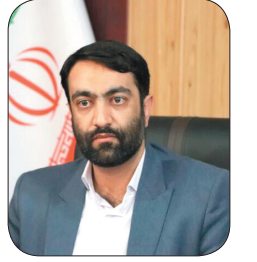
مدیرکل فرهنگ و ارشاد اسلامی چهارمحال و بختیاری: فراخوان چهار دهمین جشنواره شعر منتقدان تدارکات اردل منتشر شد