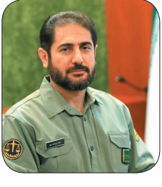
مدیرکل محیط زیست چهارمحال و بختیاری چهارمحال و بختیاری از استان‌های بختیاری است