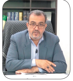
مدیرکل منابع طبیعی و آبخیزداری چهارمحال و بختیاری ۶۵ درصد سطح چهارمحال و بختیاری تحت پوشش مراتع قرار دارد