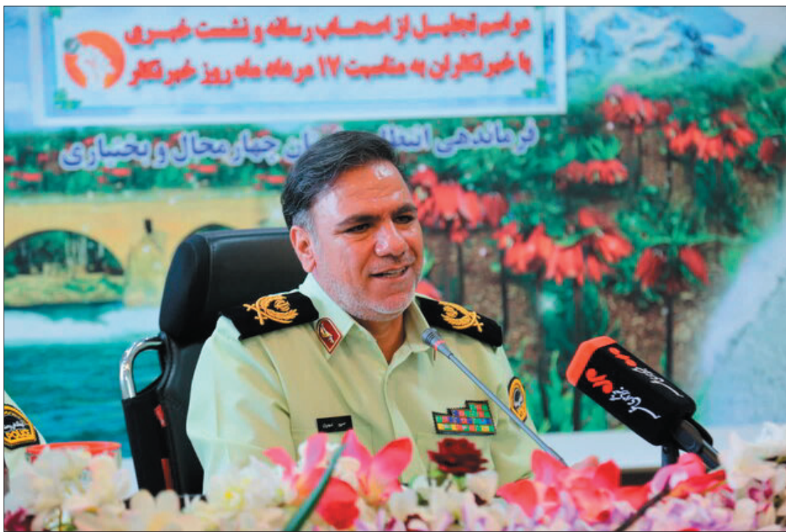
فرمانده انتظامی از اصحاب رسانه و نشست خبری با خبرنگاران به مناسبت ۱۷ مردادماه روز خبرنگار