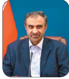
استاد چهارمجال و بختیاری برای پیشرفت و توسعه چهارمجال و بختیاری از ظرفیت مردمی استفاده کنیم