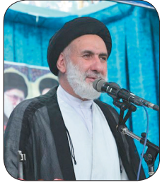
امام جمعه موقت شهرکرد ایران پاسخ اقدام غیر قانونی رژیم صهیونیستی را در زمان مناسب می‌دهد