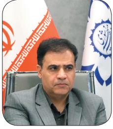
مدیرعامل شرکت توزیع نیروی برق چهارمحال و بختیاری توزیع ۲۵۰ دستگاه بکج خورشیدی بین عشایر شهرستان کوهرنگ