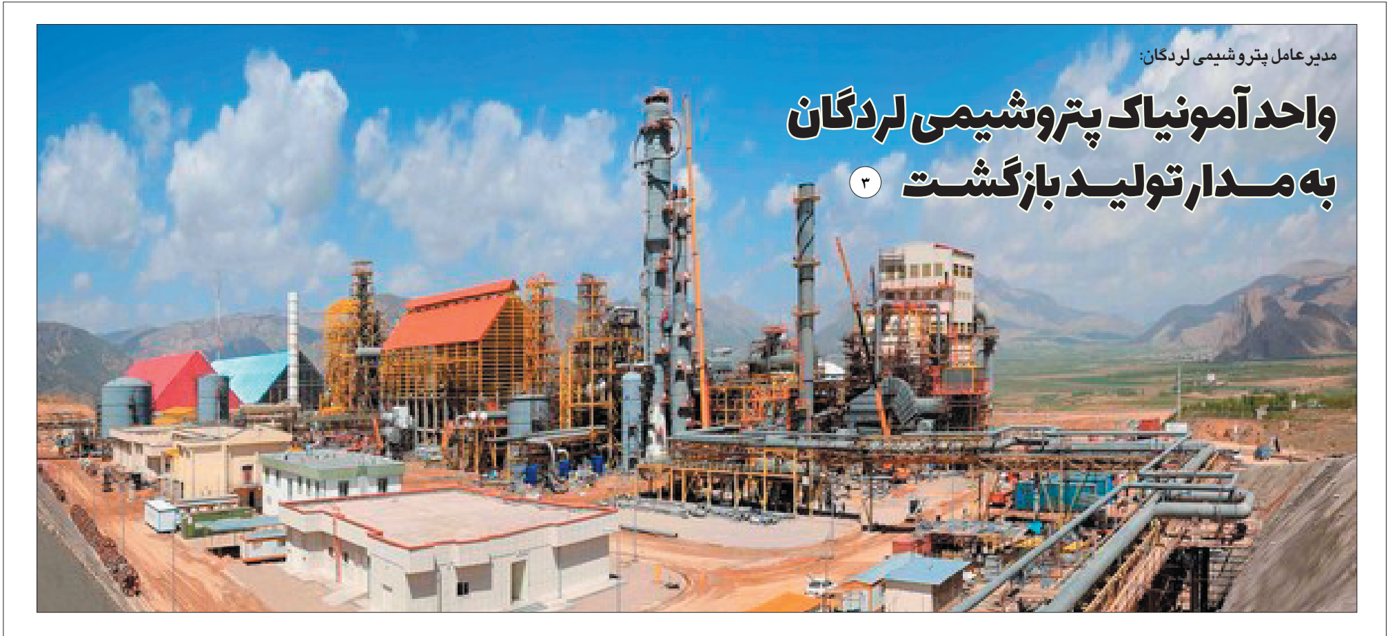
مدیرعامل پتروشیمی لردگان: