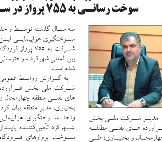
مدیر شرکت ملی پخش فرآورده های نفتی منطقه چهارمحال و بختیاری؛ طسی

بین المللی شهرکرد، بالگردهای ارگان ها و اورژانس چهارمحال و بختیاری هم در شرایط معمول و وضعیت نامساعد جوی است. تیموری افزود: این واحد تأسیساتی فعال و پویاست و با کنترل کیفی سوخت ATK و رصد وضعیت مخازن و تجهیزات فنی، عملیات سوخت رسانی امنی را برای پروازهای فرودگاه استان فراهم می کند.