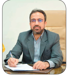
مدیرکل بنیاد مسکن انقلاب اسلامی چهارمحال و بختیاری طرح های برای ۸۳ روستای چهارمحال و بختیاری در دست اقدام است