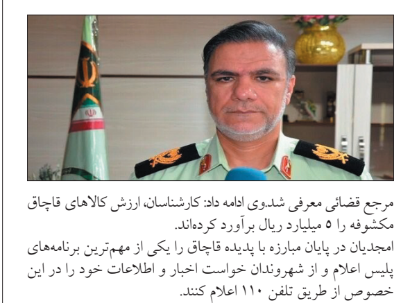
مرجع قضائی معرفی شد. وی ادامه داد: کارشناسان، ارزش کالاهای قاچاق مکشوفه را ۵ میلیارد ریال برآورد کرده‌اند. امجدیان در پایان مبارزه با پدیده قاچاق را یکی از مهم‌ترین برنامه‌های پلیس اعلام و از شهروندان خواست اخبار و اطلاعات خود را در این خصوص از طریق تلفن ۱۱۰ اعلام کنند.

فرمانده انتظامی استان چهارمحال و بختیاری از کشف انواع کالای قاچاق در محور بروجن به شهرکرد به ارزش ۵ میلیارد خیر داد. حسین امجدیان اظهار کرد: مأموران انتظامی شهرستان بروجن، به یک دستگاه اتوبوس اسکانیا حامل کالای قاچاق در محور بروجن-شهرکرد مشکوک و به منظور بررسی بیشتر آن را متوقف کردند. فرمانده انتظامی استان چهارمحال و بختیاری افزود: پلیس پس از هماهنگی‌های لازم قضائی و بازرسی از این خودرو، ۶۹۶ توب انواع البسه، انواع ساعت مچی ۳۹۲ عدد، کوله پشتی و کیف مدرسه ۵۲ عدد، انواع شیرآلات حمام، جامدادی ۱۲ عدد همگی خارجی و فاقد هرگونه اسناد و مدارک گمرکی کشف، که در این زمینه یک متهم دستگیر و به