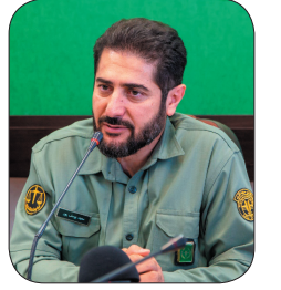
مدیرکل حفاظت محیط زیست چهارمحال و بختیاری، ۲۲ قطعه برنده از متخلفان شکار غیر مجاز در چهارمحال و بختیاری کشف شد