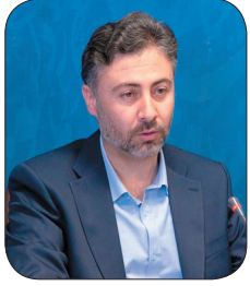
مدیرکل صنعت، معدن و تجارت چهارمحال و بختیاری، ۵۰ درصد هدف تولید محصولات راهبردی صنعتی در چهارمحال و بختیاری محقق شد