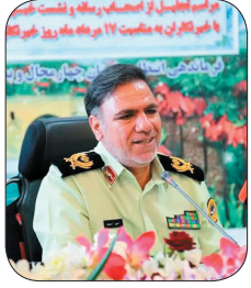
فرمانده انتظامی چهارمحال و بختیاری خبر داد: انهدام باند سارقان احشام در چهارمحال و بختیاری