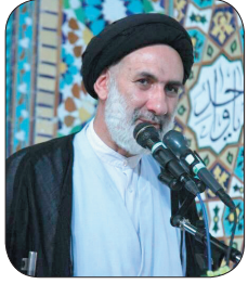
امام جمعه وقت شهرکرد: دولت چهارم با کار جهادی اعتماد مردم را به خوبی پاسخ دهد