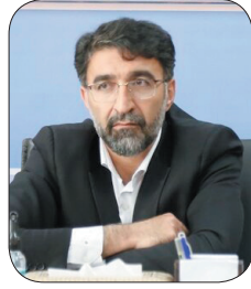
مدیرکل آموزش و پرورش چهارمحال و بختیاری: ۲۰ درصد مدارس غیر دولتی در مقطع ابتدایی سقف شوره را دریافت می‌کنند