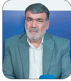
مدیرکل ثبت احوال چهارمحال و بختیاری؛ امسال پنج هزار و ۵۹۰ واقعه ولادت در چهارمحال و بختیاری ثبت شد