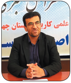
رئيس دانشگاه علمی کاربردی چهارمحال و بختیاری: پذیرش دانشجويان دانشگاه علمی کاربردی چهارمحال و بختیاری ۵۳ درصد افزایش یافت