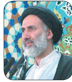
امام جمعه موقت شهرکرد: حفظ وحدت کليدواژه پيروي مقابل دشمنان تفرقه افکن است