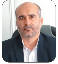
مدیرکل بیمه سلامت چهارمحال و بختیاری: ۱۷ هزار و ۳۶۱ نفر از بیماران خاص در چهارمحال و بختیاری نشان دار شدند