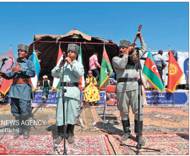
دبیر جشنواره اقوام و عشایر ایران زمین در شهرستان فارسان گفت: سال گذشته میانگین ۱۵ هزار نفر در هر شب در این جشنواره حضور داشتند که پیش‌بینی می‌شود، امسال این تعداد افزایش پیدا کند.