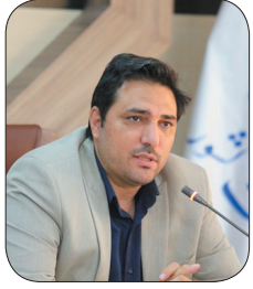
رئیس سازمان جهاد کشاورزی چهارمحال و بختیاری: چهار هزار میلیارد ریال از مطالبه کتدم کاران چهارمحال و بختیاری پرداخت شد