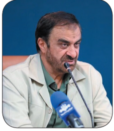
استاد چهارمحال و بختیاری انقلاب اسلامی منشأ دستاوردهای بزرگی در چهارمحال و بختیاری بود