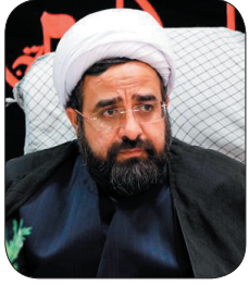
مدیرکل اوقاف و امور خیریه چهارمحال و بختیاری: امسال هشت و سفس جدید در چهارمحال و بختیاری ثبت شد