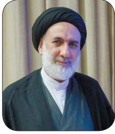
امام جمعه شهرکرد: مسیر مقاومت با شهادت مجاهدان مستحکمتر می‌شود