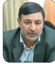
نماینده مجلس: شهادت سید حسن نصرالله جریان مقاومت را تقویت می‌کند