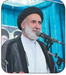
امام جمعه شهرکرد، عملیات وعده صادق ۲ اقتدار دفاعی ایران را به نمایش گذاشت