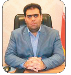
مدیرکل کمیته امداد امام خمینی (ره) چهارمحال و بختیاری، ۲۳ هزار بسته نوشتافزار بین دانش آموزان نیازمند چهارمحال و بختیاری توزیع شد