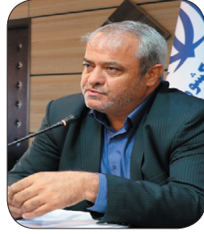
مدیرکل ورزش و جوانان چهارمحال و بختیاری: لزوم برگزاری طرح‌های استعدادیابی در چهارمحال و بختیاری