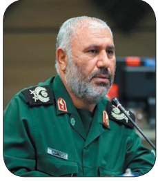
سردار اکبری در دیدار با فرمانده فرجا در بام ایران، فرجا و سپاه استان در یک راستا و هدف تلاش می‌کنند