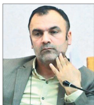
یک کارشناس رسانه معتقد است چند صدایی و احساسی عمل کردن، آفت رسانه در بحران‌هاست.

ها را بررسی، تحلیل های درست را بیان و پیش بینی ها را به شکل منطقی در اختیار افکار عمومی قرار دهد، به شکلی که هم احساس امنیت را مردم حس کنند و هم از احتمالات خطر آفرین مطلع شوند. این کارشناس حوزه رسانه گفت: متأسفانه به چند دلیل طی چند وقت اخیر فضای اطلاع رسانی مطلوبی بر جامعه ما حاکم نبوده است و علت آن سه چند چالش اساسی برمی گردد؛ یکی این که منبع واحد و موثقی برای بیان حقایق در اختیار رسانه‌های کشور نیست و چند صدایی در بیانات و اظهار نظر ها، هم مردم، هم رسانه ها و هم گاهی مجامع بین المللی را دچار ابهام، تنش و شایعه می کند.