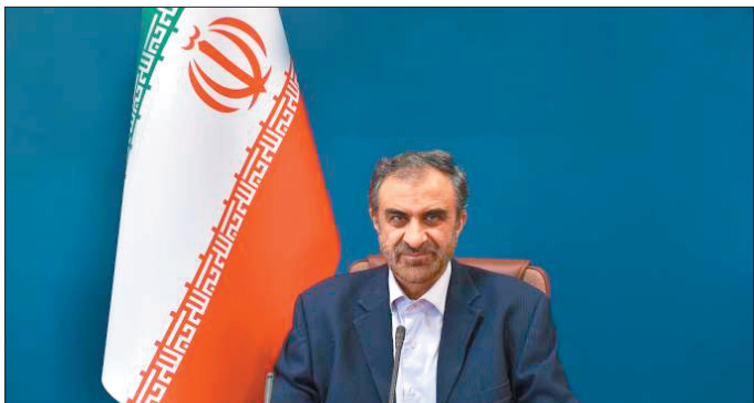
وی تأکید کرد: سرشماری کشاورزی کار ارزشمندی است که می‌تواند در صرفه‌جویی و همچنین جذب منابع به استان اثر جدی داشته باشد.