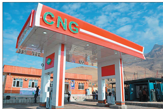
جایگاه‌های CNG استان چهارمحال و بختیاری در ۶ ماه گذشته بیش از ۴۲ میلیون مترمکعب گاز مصرف کردند.