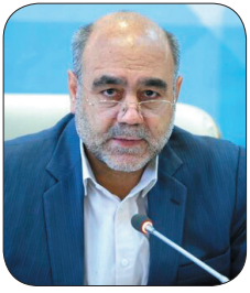
رئیس کل دادگستری چهارمحال و بختیاری پزشکان نخبگان سلامت انسانها هستند