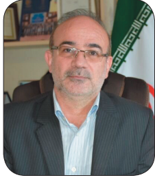
رئیس پارک علم و فناوری چهارمحال و بختیاری: صادرات محصولات دانش‌بنیان چهارمحال و بختیاری ۲۰ درصد افزایش یافت