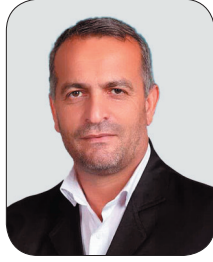
نماینده مجلس: شهادت فرماندهانی چون سنوار جریان مقاومت را متوقف نمی‌کند