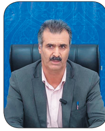
مدیرکل امور مالیاتی چهارمحال و بختیاری؛ پرداخت ۳۰۵ میلیارد تومان مسئولیت ارزش افزوده در چهارمحال و بختیاری