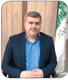
رئیس سازمان مدیریت و برنامه‌ریزی چهارمحال و بختیاری؛ پیش‌بینی بیش از ۴۶ میلیارد تومان کمک فنی و اعتباری برای چهارمحال و بختیاری