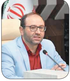
شهردار شهرکرد بسیار تونل نوری شهرکرد به بهره‌برداری رسید