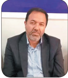
سرپرست اداره کل ارتباطات و فناوری اطلاعات چهارمحال و بختیاری: بیش از ۸۳ هزار خانوار روستایی چهارمحال و بختیاری به شبکه ملی اطلاعات متصل شدند