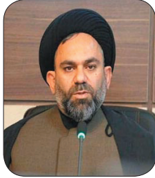
رئیس شورای هماهنگی تبلیغات چهارمحال و بختیاری: تغییر مسیر راهپیمایی یوم‌الله ۱۳ آبان در شهرکرد