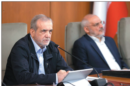
عجم، کرد و بلوچ نیست، ما با در کنار هم بودن می‌توانیم به قدرت و وفاق ملی برسیم تا جایی که نگذاریم بیگانگان نگاه نامناسبی به کشور ما داشته باشند.

یکی بودن و پرهیز از برتری قومی بر دیگری است، گفت: همان‌طور که خداوند متعال در قرآن مجید می‌فرماید «یا أَيُّهَا النَّاسُ إِنَّا خَلَقْنَاكُمْ مِنْ ذَكَرٍ وَأُنْثَىٰ وَجَعَلْنَاكُمْ شُعُوبًا وَقَبَائِلَ لِتَعَارَفُوا إِنَّ أَكْرَمَكُمْ عِنْدَ اللَّهِ أَتْقَاكُمْ إِنَّ اللَّهَ عَلِيمٌ خَبِيرٌ» هیچ‌کسی نسبت به دیگری برتری ندارد، مگر با تقوا و این شعار و سرلوحه کار ما است.