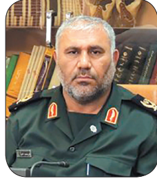
فرمانده سپاه حضرت قمر بنی هاشم (ع) استان، اجلاس شهدای ارتش چهار محال و بختیاری بر گزار می شود