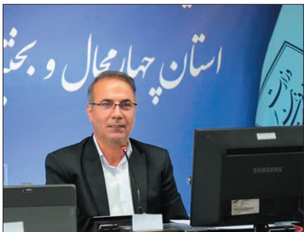
درآمدزایی سرد و صنعتی که باید با چرخ گردشگری چهارمحال و بختیاری گسترش کند به این موضوع پرداخته شده است.

امام جماعت هر دستگاهی برای اقامه نماز باید در یکی از مدارس استان حضور یابد. وی با اشاره به پیش‌بینی دوره‌های آموزشی ویژه کارکنان دستگاه‌های اجرایی استان تصریح کرد: همه ادارات موظف به برگزاری این دوره‌ها هستند و گزارش عملکرد آن را باید به ستاد اقامه نماز استان ارسال کنند. دبیر ستاد اقامه نماز چهارمحال و بختیاری تأکید کرد: اگرچه ترویج فرهنگ اقامه نماز کارهای فرهنگی مؤثر و جذابی را می‌طلبد اما نیاز است تا اعتبارات بیشتری به این بخش اختصاص داده شود. در این گردهمایی از دبیران اقامه نماز شهرداری شهرکرد، آموزش و پرورش، دانشگاه فرهنگیان و صدا و سیما مرکز استان به عنوان دبیران برتر استان تجلیل شد.