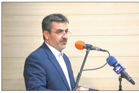
توزیع اعتبارات تملک، استفاده از تمام ظرفیت‌های مالی قانون بودجه و تعادل بخشی بین شهرستان‌ها از دیگر رویکردهای این سازمان است.