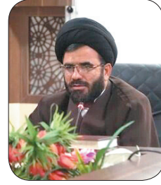
مدیرکل تبلیغات اسلامی چهارمحال و بختیاری: ۱۳ آبان پیام مقاومت را به مردم برسانیم