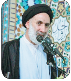
امام جمعه شهرکرد ایران اسلامی هیچ‌گاه روحیه ذلت‌پذیری نداشته است