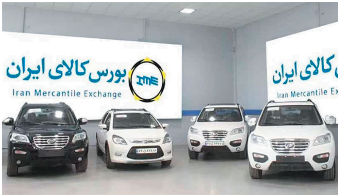
متن کامل در صفحه ۲

تجربه تلخ و سیاه عرضه خودرو در بورس که خسارت‌های بسیاری به مردم و بازار خودرو وارد ساخت، این روزها بار دیگر در حال رقم خوردن است در حالی که همچنان ادعای مقابله با دلالی و نزدیک کردن قیمت به بازار بهانه این اقدام است. در حالی که تجربه تلخ عرضه خودرو در بورس کالا و تاثیرات توری آن بویژه گران فروشی به مصرف کننده با ادعای عرضه و تقاضا همچنان در ذهن همگان مانده است اما گویا خودروسازان بار دیگر با ادعای زیان انباشته به دنبال تکرار همان شیوه هستند که نتیجه آن نیز فروش بالاتر از