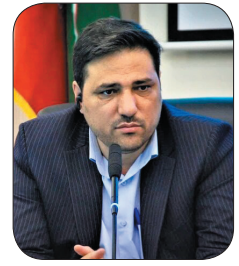
رئیس سازمان جهاد کشاورزی چهارمحال و بختیاری: سهمیه سوخت بخش کشاورزی چهارمحال و بختیاری ناکافی است