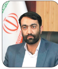
مدیرکل فرهنگ و ارشاد اسلامی چهارمحال و بختیاری: صنعت چاپ، صنعتی مردم‌گراست