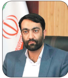
مدیرکل فرهنگ و ارشاد اسلامی چهارمحال و بختیاری؛ جنسواره ناتاز استانی از رشد کمی و کیفی قابل توجهی برخوردار بود