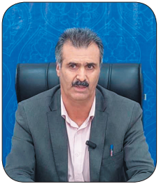
مدیرکل امور مالیاتی چهارمحال و بختیاری؛ کمک‌های مالیاتی به شهرداری‌ها و دهیاری‌های چهارمحال و بختیاری افزایش یافت