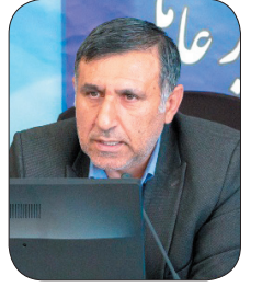
مدیرعامل شرکت آب و فاضلاب استان چهارمحال و بختیاری ۲۱ پروژۀ فعال آبفا در طرح نهضت ملی مسکن