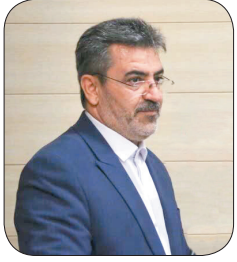
رئیس سازمان برنامه و بودجه چهارمحال و بختیاری ۲ هزار و ۹۴۰ معلم چهارمحال و بختیاری در آستانه بازنشکته هستند