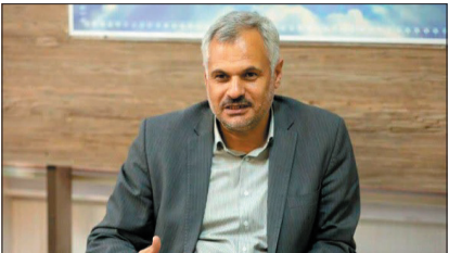
معاون سیاسی، امنیتی و اجتماعی استاندار چهارمحال و بختیاری گفت: ظرفیت‌های موجود در ساختارهای اداری برای توسعه فرهنگ و هنر بکار گرفته شود.

سرپرست معاونت سیاسی، امنیتی و اجتماعی استاندار چهارمحال و بختیاری گفت: ظرفیت‌های موجود در ساختارهای اداری برای توسعه فرهنگ و هنر بکار گرفته شود.