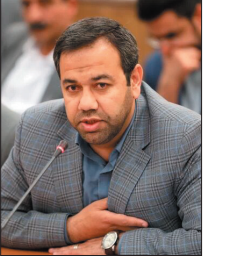
مدیرعامل شرکت شهرکهای صنعتی چهارمحال و بختیاری اجرای پروژههای زیرساختی در ناحیه صنعتی بندگان