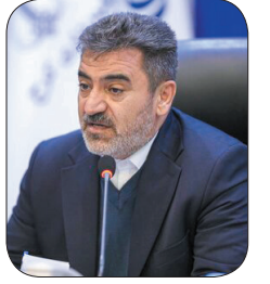
رئیس سازمان مدیریت و برنامه‌ریزی چهارمحال و بختیاری، شناسایی بالغ بر ۸۰ هزار بهره‌بردار کشاورزی در چهارمحال و بختیاری