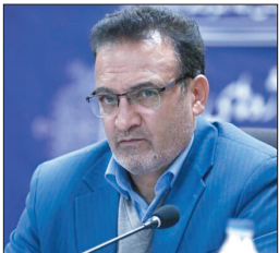
فرماندار شهرستان بروجن