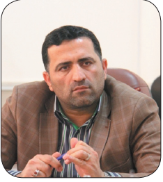
رئیس چهارم دانشکاهی چهارمحال و بختیاری، رقابت ۵۶ تیم در مناظرات دانشجویی چهارم دانشکاهی چهارمحال و بختیاری