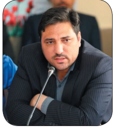
رئیس سازمان جهاد کشاورزی چهارمحال و بختیاری: در پی کاهش بارش‌ها، کشاورزان چهارمحال و بختیاری نسبت به آبیاری باغات و مزارع اقدام کنند