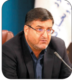
استادان: برنامه‌های روز چهارمحال و بختیاری در جهت وفای اقوام استان اجرا شود