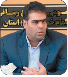
مدیرکل کمیته امداد چهارمحال و بختیاری: پیش‌بینی افزایش دو برابری معتمدان تحت حمایت کمیته امداد چهارمحال و بختیاری