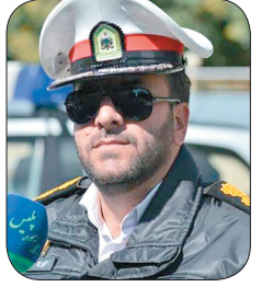
رئیس پلیس راهور چهارمحال و بختیاری: جذب بازرسان افتخاری کنترل نامحسوس ترافیک در چهارمحال و بختیاری