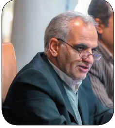
معاون استاندار چهارمحال و بختیاری اعتبارات مشاغل خانگی زودتر جذب شود