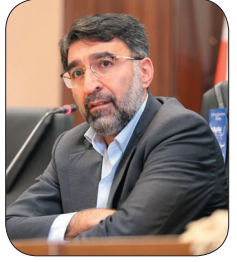
مدیرکل آموزش و پرورش چهارمحال و بختیاری شرکت ۱۱ هزار نفر از دانش آموزان چهارمحال و بختیاری در اعتکاف