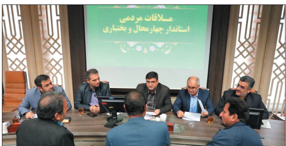
ملاقات مردمی استاندار چهارمحال و بختیاری