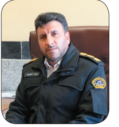
رئیس پلیس راهور چهارمحال و بختیاری خبر داد: بیش‌بینی ۱۰ مرکز معاینه فنی در چهارمحال و بختیاری