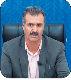
مدیرکل امور مالیاتی چهارمحال و بختیاری: مالیات بیش از ۶۰ درصد صاحبان مشاغل در چهارمحال و بختیاری صفر است