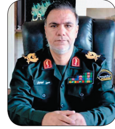
فرمانده انتظامی چهارمحال و بختیاری: ۳۶۶ کیلوگرم مسود مخدر در چهارمحال و بختیاری کشف شد