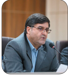
استاندار چهارمحال و بختیاری: دهه فجر بستری برای تقویت وفاق و همدلی در جامعه باشد