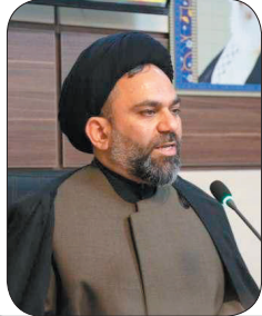
رئیس شورای هماهنگی تبلیغات اسلامی استان، برگزاری بیش از ۵۰۰۰ عنوان برنامه دهه فجر در چهارمحال و بختیاری